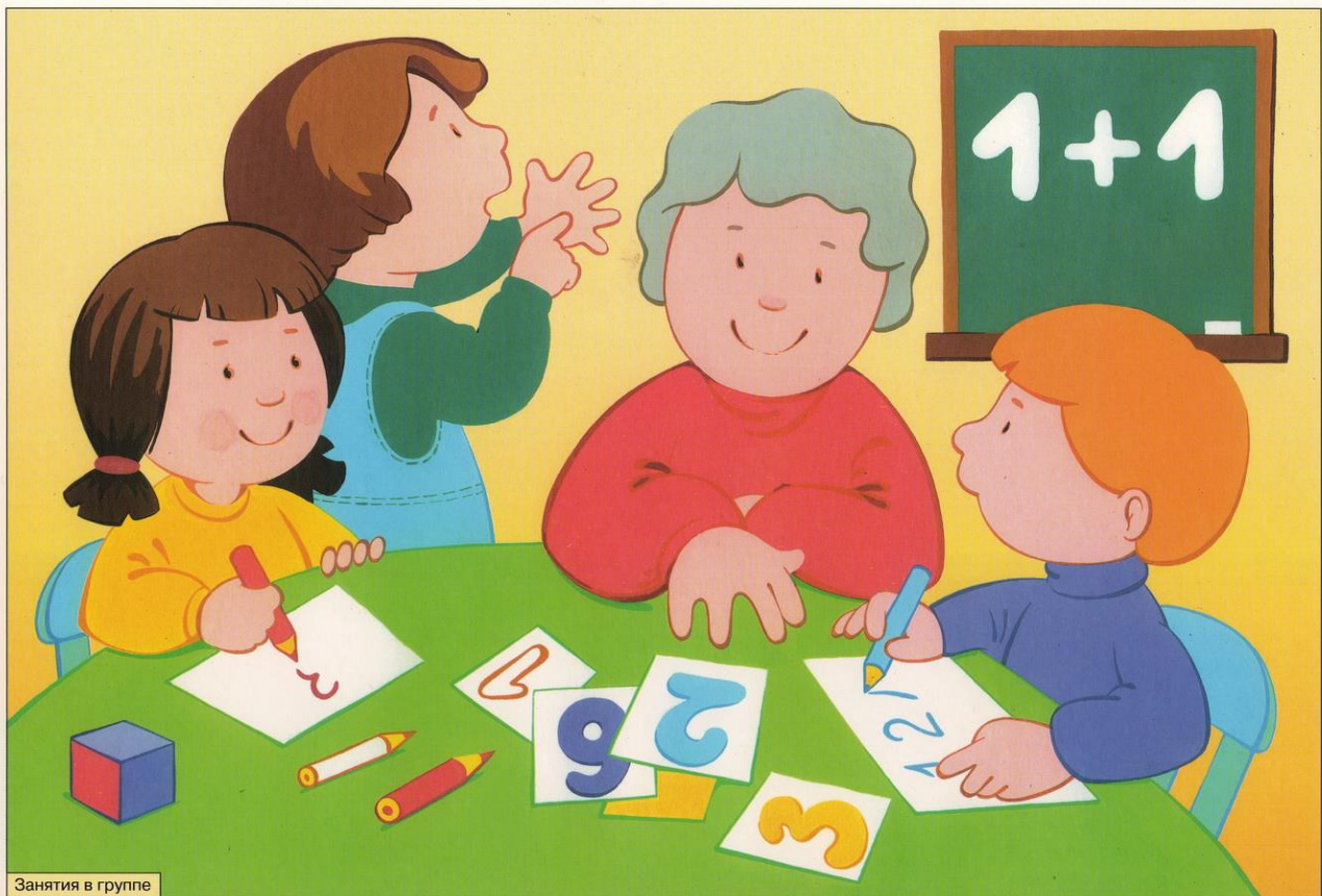
Занятия в группе

Поведение ребенка в детском саду, его настроение, работоспособность находятся в прямой зависимости от того, как организованы его деятельность и сон в семье в обычные, а так же в выходные дни. Выходные дни дети проводят дома, как правило, с существенными отклонениями и даже нарушениями привычного режима. Неслучайно функциональный уровень детей в понедельник хуже, чем во второй – третий день недели. Поэтому домашний режим ребенка в те дни, когда он не посещает детский сад, не должен отличаться от режима дошкольного учреждения.