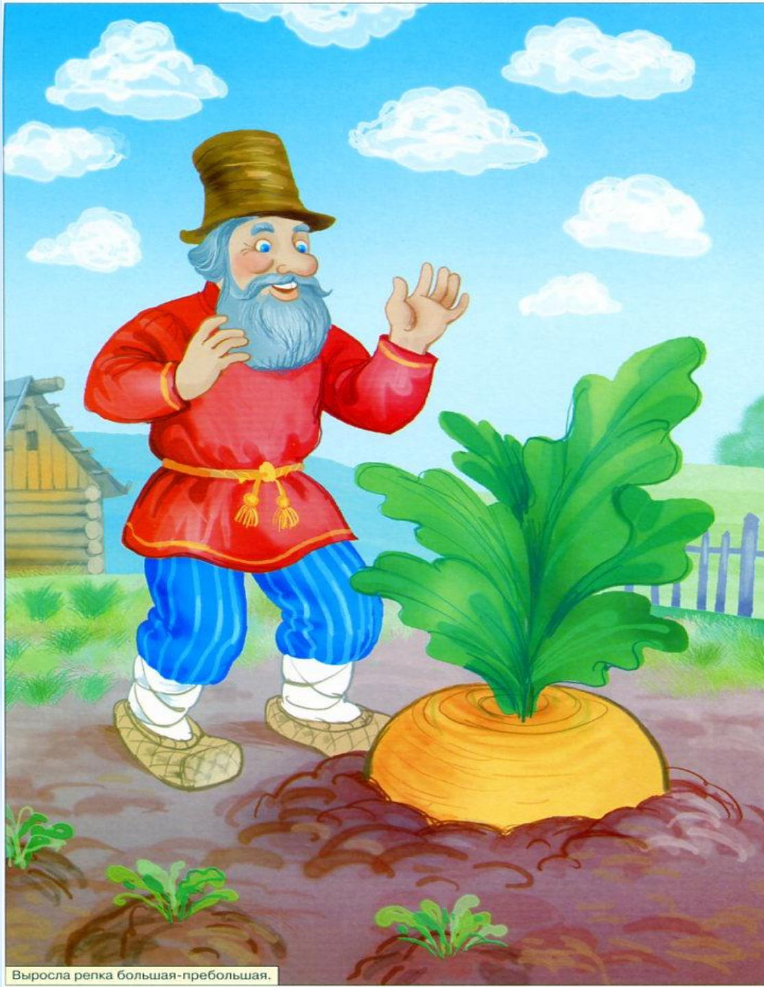
Выросла репка большая-пребольшая.