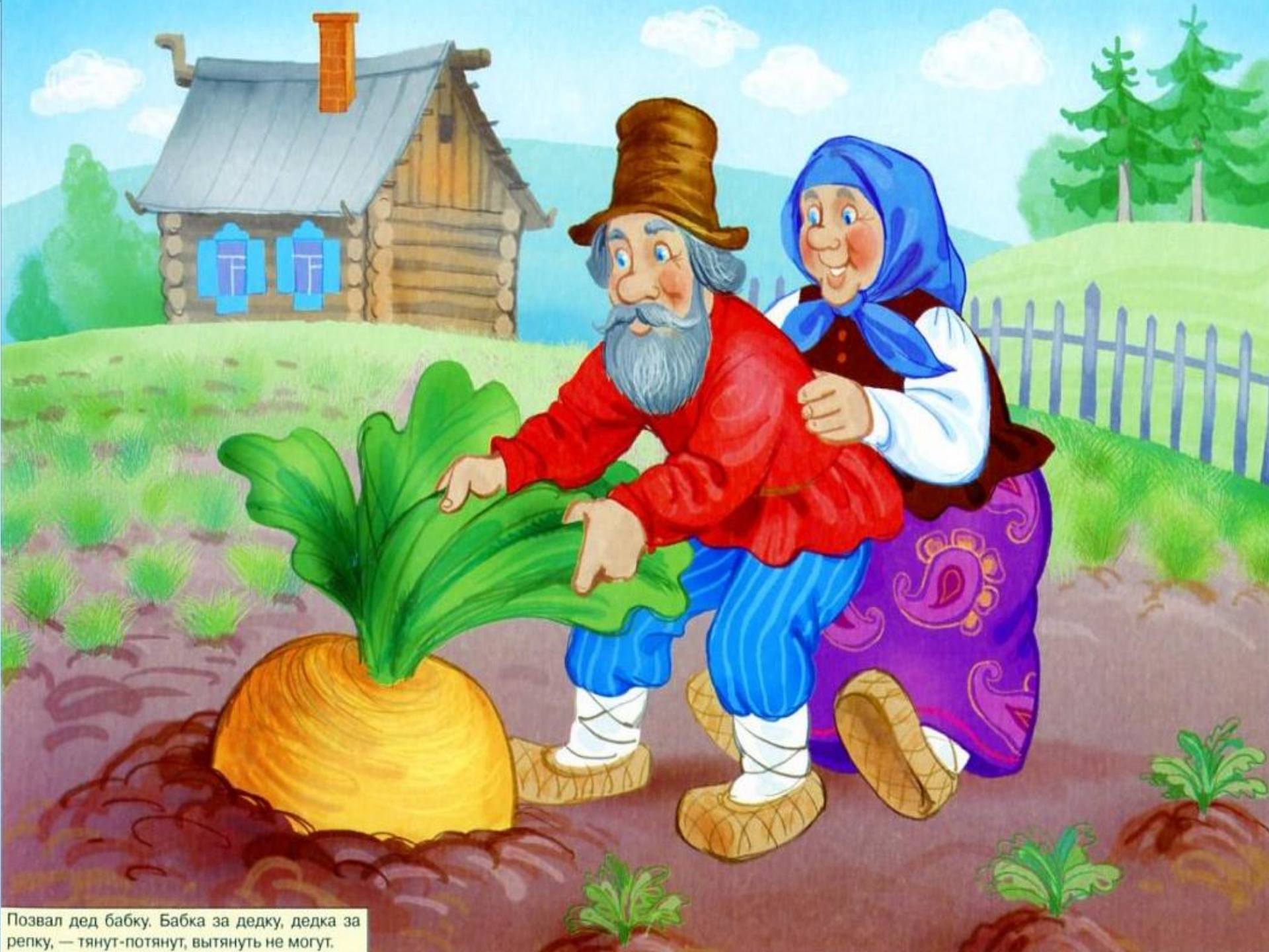
Позвал дед бабку. Бабка за дедку, дедка за репку, — тянут-потянут, вытянуть не могут.